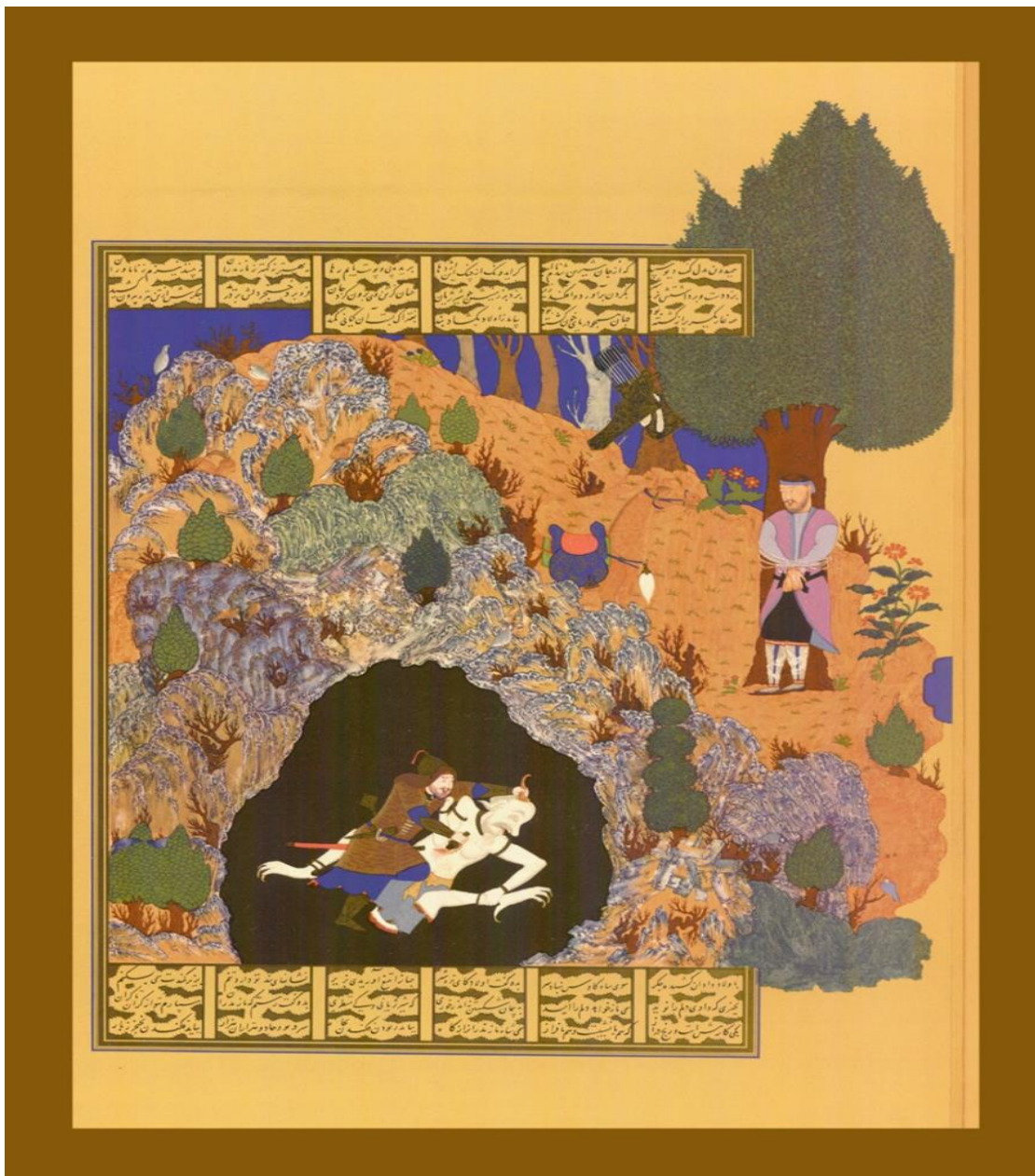
تصویر شماره «۱» - نبرد رستم با دیو سپید در نسخه بایسنقری (فردوسی، ۱۳۵۰: ۱۰۱)